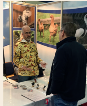
Am VDT-Stand war eine Sonderausstellung des Deutschen Taubenmuseums Nürnberg plaziert.