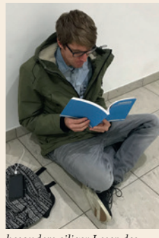
besonders eiliger Leser des neuen VDT-Jahrbuches