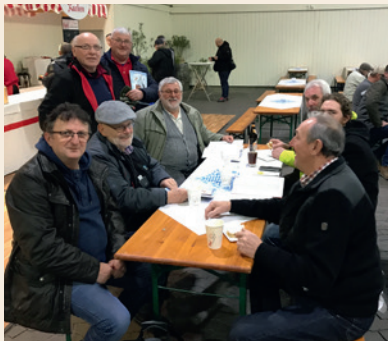
Nach der Fachdiskussion ist vor der Fachdiskussion!

Der VDT-Vorstand war bemüht, über einen Antrag an die GV/BHV des BDRG in Niefern im Mai dieses Jahres einen Standgeldzuschuss in Höhe von 1.00 € je