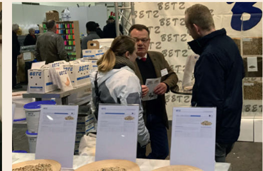
Unser Premiumpartner, die Fima Betz, stellt die neue Vital-Perle vor.