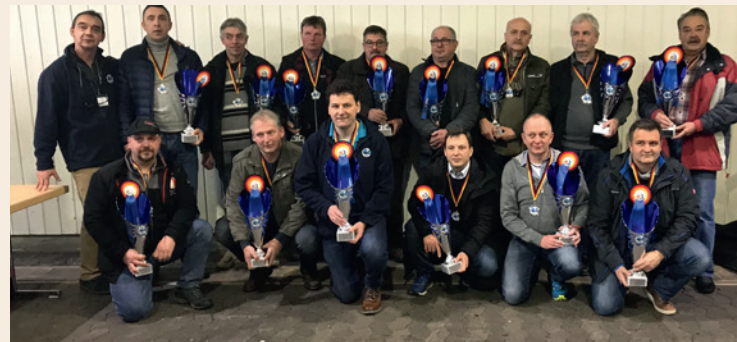
Züchter der Champions der Deutschen Rassetaubenzucht 2018